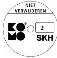
geschikt voor weerstandsklasse 2